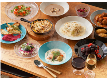
オリジナルレシピの北欧料理

詳細・申込方法：お申込みサイト ( http://peatix.com/user/893184/ ) もしくは店頭にてお申込みください。