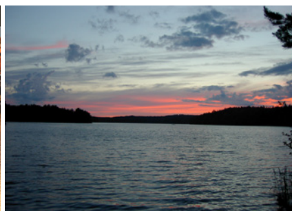
フィンランドの白夜の風景